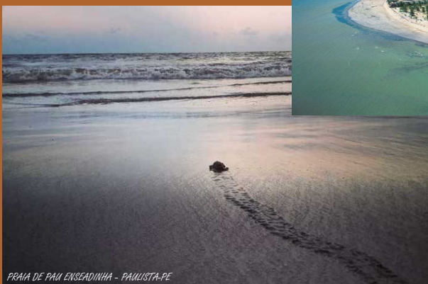
PRAIA DE PAU ENSEADINHA - PAULISTA-PE