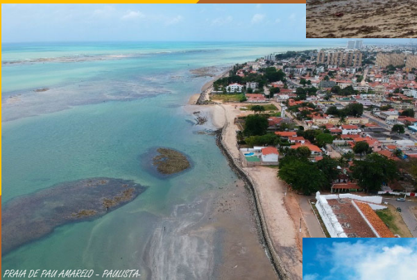
PRAIA DE PAU AMARELO - PAULISTA