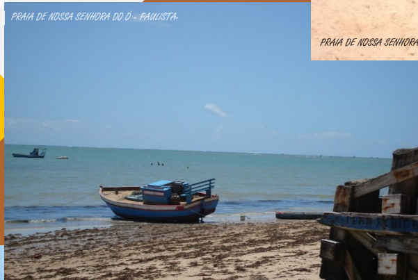
PRAIA DE NOSSA SENHORA DO Ó - PAULISTA