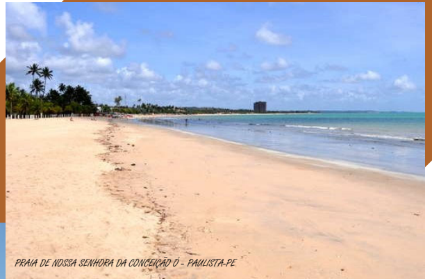
PRAIA DE NOSSA SENHORA DA CONCEIÇÃO O - PAULISTA-PE