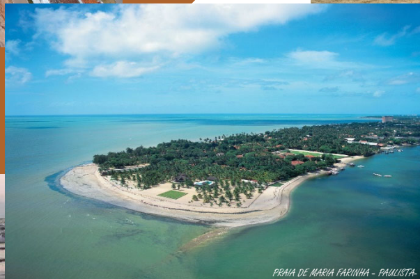
PRAIA DE MARIA FARINHA - PAULISTA