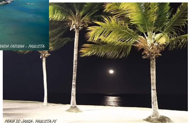
PRAIA DO JANGA- PAULISTA-PE